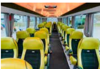
GRAND CLASS-Bus Sitzplan

Details auf www.club50.at & in unserem Kundenzentrum.