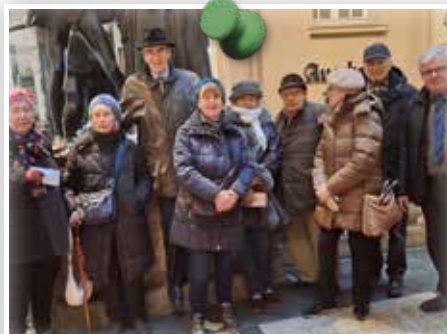
CLUB 50-Gruppe Silvester in Leipzig im Dezember 2025