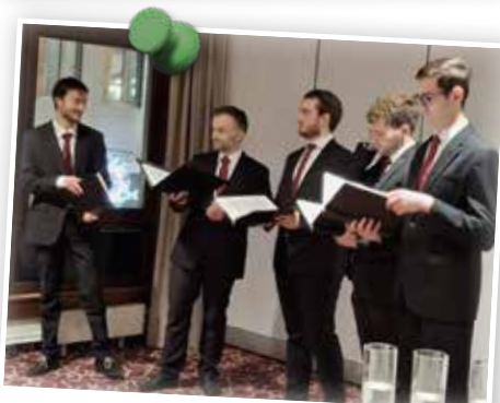
Adventtreffen in Dresden – Ehemalige Sänger des Kreuzchors im Dezember 2025

Wollen auch Sie bei einem unserer beliebten CLUB 50-Adventtreffen dabei sein?