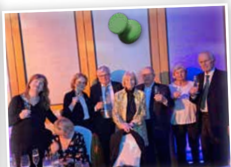
CLUB 50-Gruppe Silvester in Leipzig im Dezember 2025