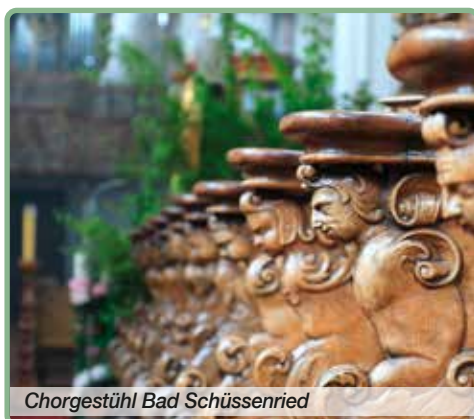
Chorgestühl Bad Schussenried

Wir werden Tage erleben, in denen Architektur, Landschaft und Geschichte eine harmonische Einheit bilden – und in denen auch Muße, Genuss und Gemeinschaft ihren festen Platz haben.