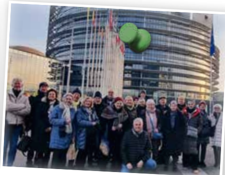
CLUB 50-Gruppe Silvester Baden Baden & Straßburg im Dezember 2025