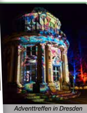
Adventtreffen in Dresden