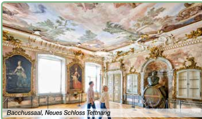
Bacchusaal, Neues Schloss Tettang