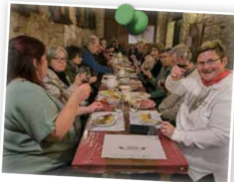
CLUB 50-Gruppe Geheimnisvolle Südtoskana im Oktober 2025