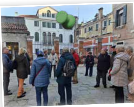
CLUB 50-Gruppe Venedig im November 2025