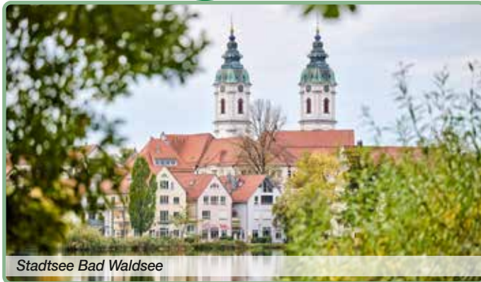
Stadtsee Bad Waldsee

Im hauseigenen Restaurant werden regionale schwäbische Spezialitäten ebenso serviert wie internationale Gerichte, und im Sommer lädt die sonnige Terrasse zum Genießen ein. Die Lage mitten im Oberschwaben-Urlaubsgelände macht das Haus ideal für Städtereisen, Ausflüge zum Bodensee oder Erkundungen der Barockstadt Weingarten und der historischen Altstadt von Ravensburg.