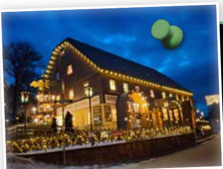
Adventtreffen in Dresden – Besuch in Seiffen im Dezember 2025

Gleich anmelden! Die Buchungen sind in vollem Gang!