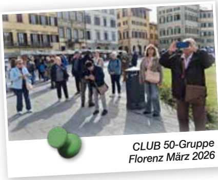
CLUB 50-Gruppe Florenz März 2026

reiche Entdeckungen durch Florenz und Venedig. Dabei wurden Konzerte besucht, feinste Küche probiert sowie frühlingserwachende Gärten & Palazzi besucht.