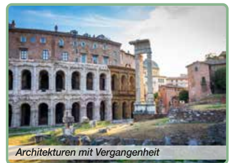
Architekturen mit Vergangenheit

– Sind Sie bereit, mit uns zu träumen, zu verreisen – für das Dolce Vita, für all die Kunst, Kultur, Musik und Kulinarik Italiens? Dann begleiten Sie uns auf den folgenden Seiten auf eine inspirierende Reise – und vielleicht schon bald ganz real.