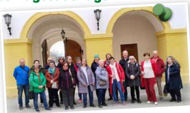
CLUB 50-Gruppe Ostern auf Schloss Hof März 2026