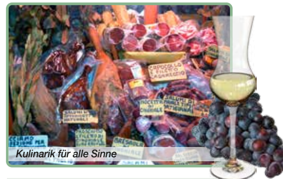
Kulinarik für alle Sinne

CLUB 50-SPRUCH DIESER AUSGABE Du kannst das Universum haben, wenn ich Italien haben darf.