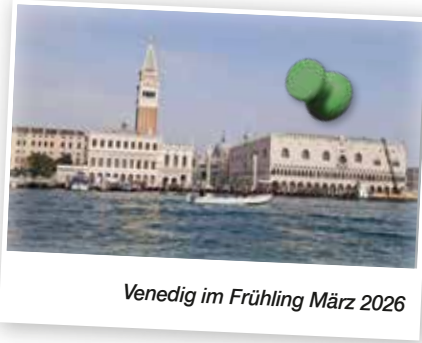
Venedig im Frühling März 2026