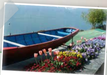
Wir sehen uns dann später!