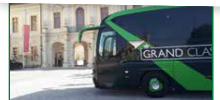
GRAND CLASS-Bus Sitzplan