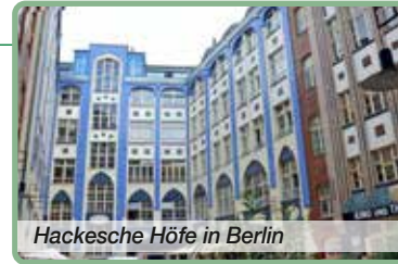
Hackesche Höfe in Berlin

Literatencafés, Künstlersalons, stille Höfe, verborgene Geschichten & musikalische Sternstunden im Beethoven-Jahr 2027