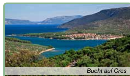
Bucht auf Cres