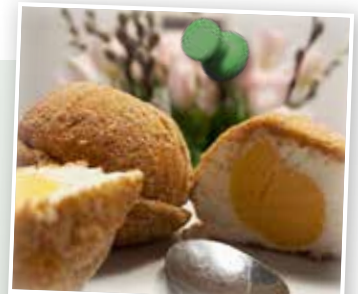
Eismarillenknödeln – Ein erfrischender Genuss

(Aufgrund begrenzter Teilnehmerzahl ist eine Anmeldung bitte unbedingt erforderlich.)