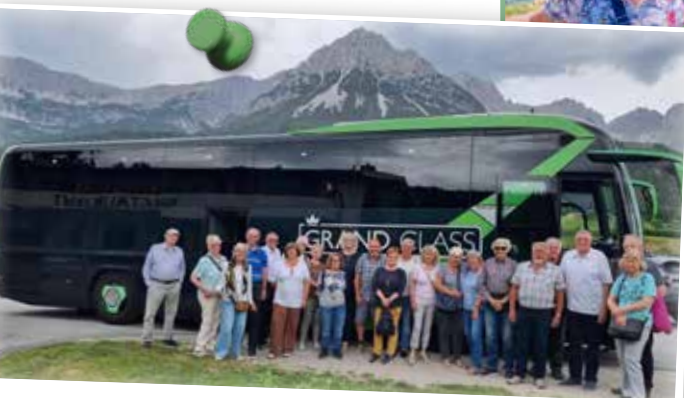
CLUB 50-Gruppe „BIG5 Bergbahn-Abenteuer Schweiz“ vom 24.05.2026 - Die neuen Termine 2027 sind da, siehe rechte Spalte -