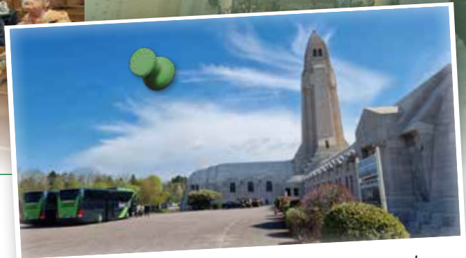
Mit dem GRAND CLASS-Bus zum CLUB 50-Großtreffen nach Lothringen im April 2026