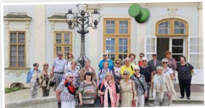
CLUB 50-Gruppe auf Schloss Halbturn „Konzert & Lesung“ vom 30.05.2026

Möchten auch Sie eines der Halbturner Schlosskonzerte besuchen? Dann bietet sich am 17.09. die nächste Gelegenheit, wenn der CLUB 50 den Konzertabend „Glanzstücke aus Oper & Operette“ besucht: